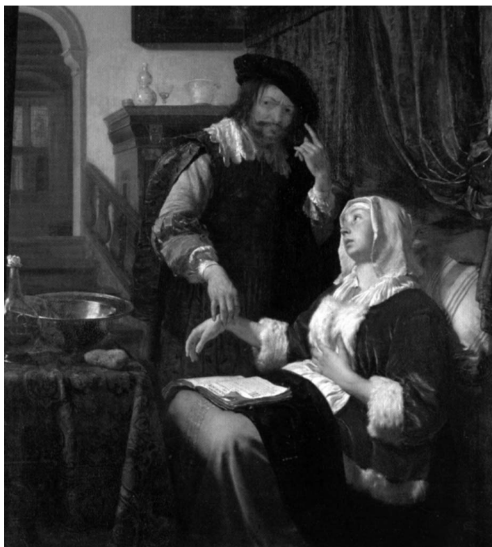
Frans van Mieris - La visita del medico (1657)

Ben si può, però, obiettare che anche una divisione ospedaliera, nel caso in cui ospiti molti pazienti o abbia un continuo ricambio delle degenze, soprattutto in una visione aziendalistica, necessita anche di un potere di intervento diretto da parte dei medici che collaborano