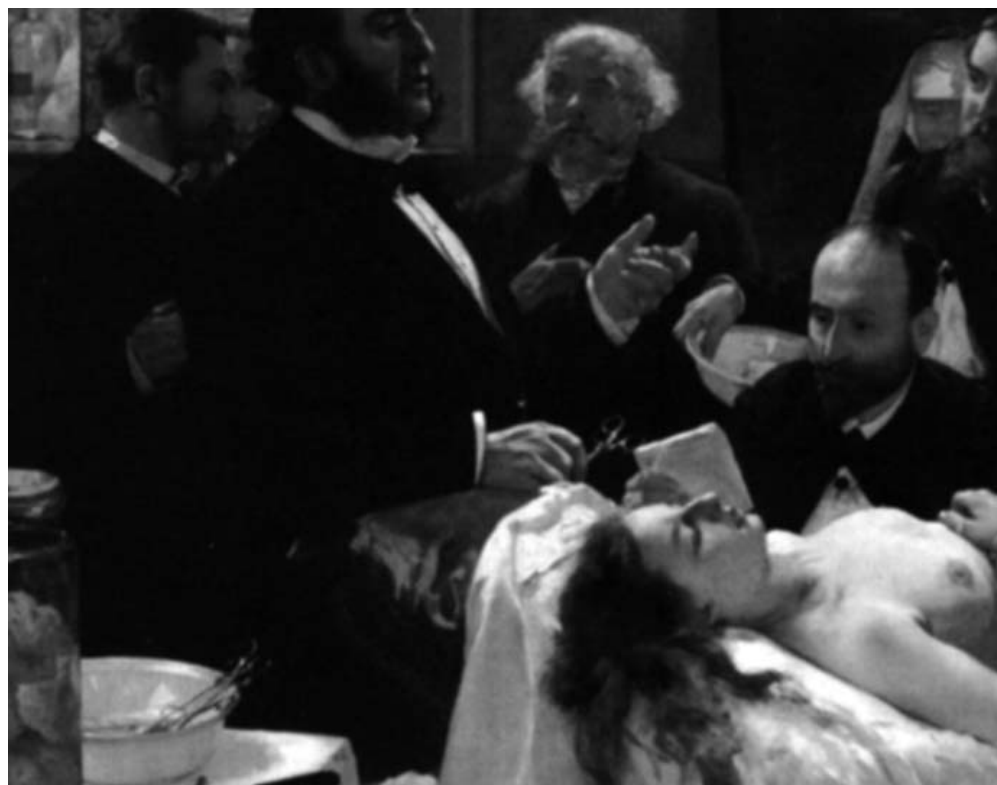
Henry Gervex - Prima dell'operazione (1887)

che mediante direttive a tutto il personale operante nella stessa e l'adozione dei provvedimenti relativi, necessari per il corretto espletamento del servizio; spettano in particolare al dirigente