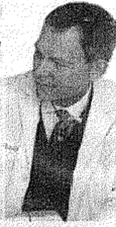
Foto: rivista con la rivista che si basano sulla ricerca e sulla ricerca di ricerca.

Foto: Indagine Cineas, su un campione di 800 pazienti e 100 operatori sanitari.